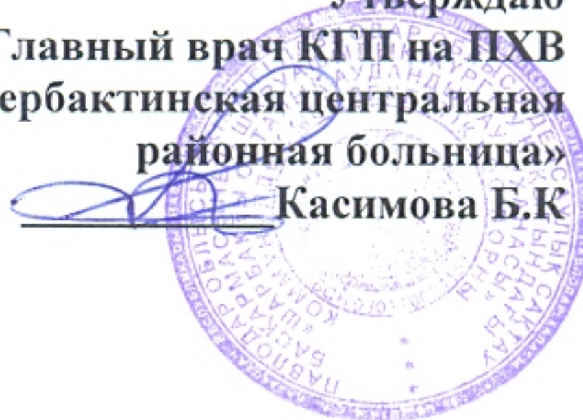
График работы школ здоровья по ВА