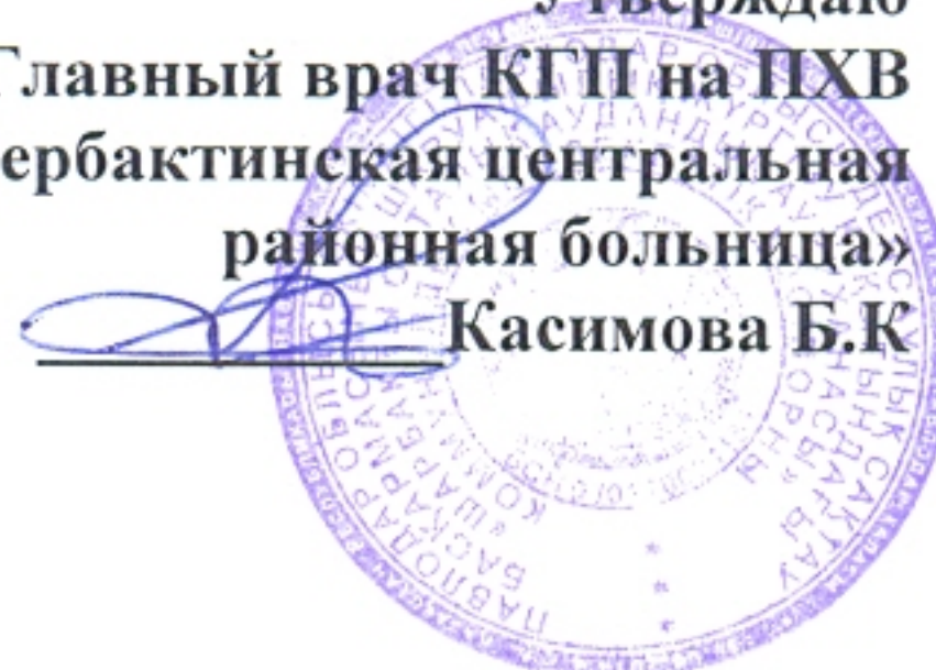
График работы школ здоровья по ВА